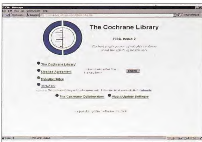
Fig. 4. Cochrane-databasene er tilgjengelig på Internett. De består av en database over systematiske overskrifter, en database over sammendrag av overskrifter om effekt av behandlinger, en database over randomiserte kontrollerte studier, samt annen informasjon om hvordan å analysere og vurdere vitenskapelige artikler og evidensbasert klinisk praksis.

Dersom det er små forskjeller og stor variasjon innen to grupper som skal sammenliknes, trengs store utvalgsstørrelser for å etablere statistiske konklusjoner med rimelig grad av holdbarhet (dvs. såkalt 80 % styrke). Antallet pasienter som er inkludert i publiserte kliniske studier om regenereringsteknikker (Tabell 3) er med få unntak langt fra hva som burde forventes for å kunne etablere statistisk holdbare konklusjoner. Dette gjelder både de