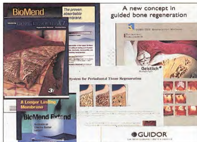
Fig. 1. Den kommersielle markedsføringen av teknikker for regenerering av periodontalt vev rettet mot tannleger er betydelig.